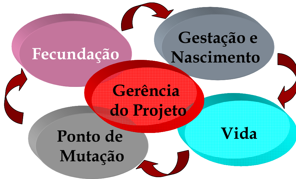
Ciclos do Projeto de Vida

Os Ciclos do Projeto: apresenta uma visão gráfica das fases cíclicas do projeto de vida. Os temas associados são os Processos de Gestão de Projetos, Introdução à Gerência de Projetos, Gestão de Integração e Gestão do Tempo.